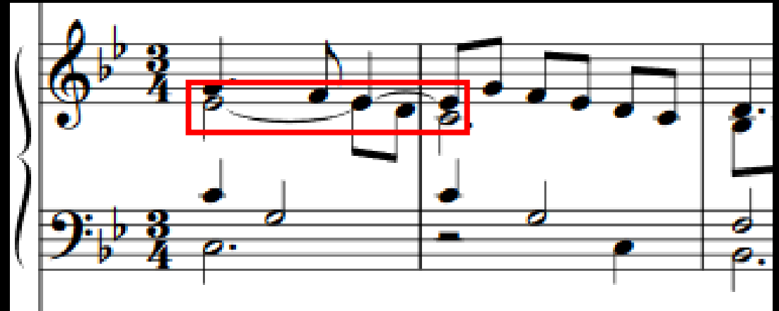
M. Neusidler – Saltarello antico, Transkription: C. Jacobs